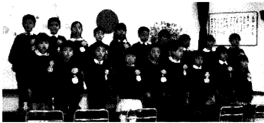
みどり組さん 修了おめでとう！！ これからも、やさしい子 がんばる子 矢賀の良い子で、大きくなってね。