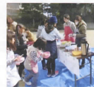
古江東町 きなこ・あんこ・のり… 何にしようかな

古江西町は、12月17日(土)、古田公民館で。古江東町は、1月22日(日)、古江新宮神社で。田方は、22日(日)、「どんど」と同時開催。古江新町は、古江新町公園で28日(土)に行いました。男性陣の力強いもちつき、初めて杵を握る人のきこちな様子、小さな杵を使う子どもたちの姿がありました。