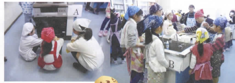
はやく焼けないかな～

《子ども お菓子作り教室》 古田母親クラブ 2月4日(土)、古田公民館実習室。バレンタインに近いこの日、子どもたちは、午前と午後のコースにわかれ、『ココアケーキ、チョコチップスコーン、簡単なプリン』を母親クラブのメンバーに教わりながら作りました。