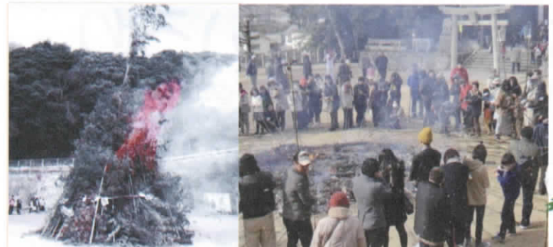
田方 とんど 古江 とんど

古江新宮神社 1月14日(土)、雪が時おり降る中、午前中「どんど」を組み立てました。午後1時、年男によって点火され、「どんど」は勢いよく燃え上がりました。火がおさまり、消防団の手により平らにならされた灰の上で、竹の先に