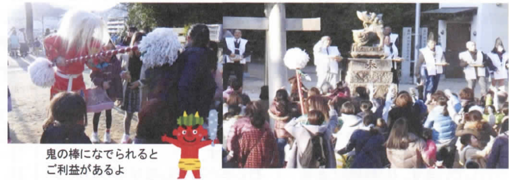
鬼の棒になでられると ご利益があるよ

町内運動会にむけて 1月28日(土)、古田公民館研修室1で、今年5月に初開催となる「古田小学校区町内運動会」の実行委員会会議がありました。