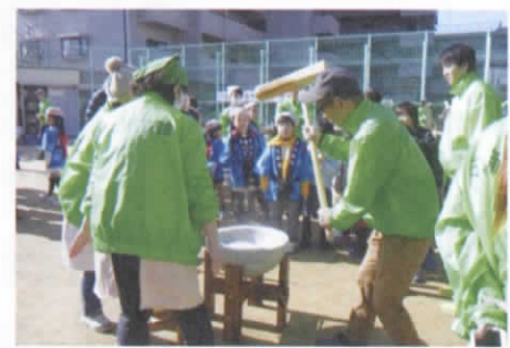
古江新町もちつき大会の様子