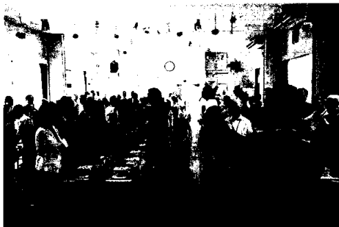
畑石県議会議員の音頭で乾杯