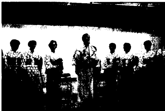
「五嬢」と地元女性のコラボ