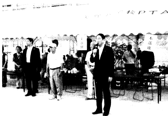
岸田外務大臣の挨拶

これも「県民踊」の皆さんや、会場準備・ 運営をいただきました町内会・各種団体 の皆さまのおかげだと感謝いたしております。