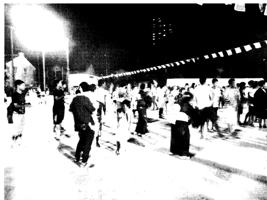
輪になって盆踊り

最後まで踊って頂いた方には、準備さ れていた大人用と子供用の「おみやげ」を それぞれ持ち帰って頂きました。暑い中 の熱演、大変ありがとうございました。