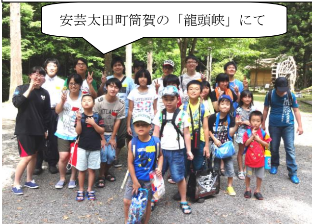
安芸太田町筒賀の「龍頭峡」にて

参加者から、『学校では経験できない貴重な体験がたくさんできた』という感想が聞かれました。