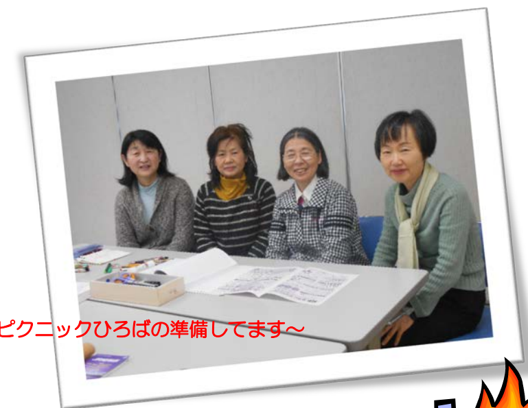
～ピクニックひろばの準備してます～