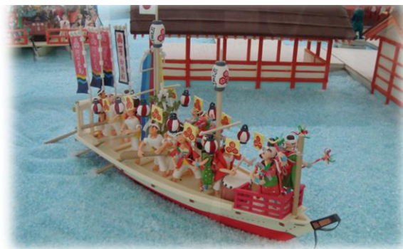
なんと！菓子博では行列で見られなかったお菓子で作られた厳島神社を、間近でじっくり見ることができました！みごとな出来栄えにため息が…。

広島空港見学は、前日の大雪の影響で残念ながら飛行機の離着陸は見られませんでした。でも、ひろしま菓子博に展示されていたお菓子で作られた厳島神社をじっくりと鑑賞でき、得した気分でした！