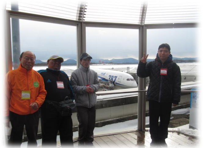
飛行機をバックに「ハイチーズ！」。雪のため、飛行機の離着陸が見られず残念でした。

みはらし温泉では、ご家族やボランティアさん、ヘルパーさんと一緒に温泉に入ったり、バイキングを食べまくったりとそれぞれが自由に過ごしました。