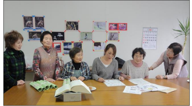
▲ほことり新聞編集集中

12月18日(水) 14時から1時間、編集委員2人と担当者(新聞に掲載する記事集め)2人、お手伝いの方2人が集まり、ほことり新聞の仕上げと印刷、配布準備をされていました。