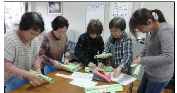
▲ほことり新聞配布準備

これからも阿戸地区の高齢者の為に、心温まるボランティア活動をしていただきたいと思います。