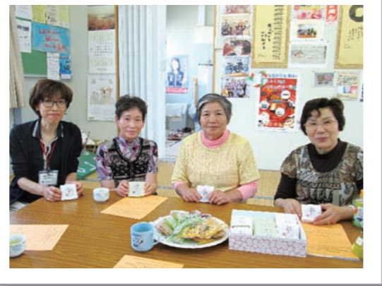
「おいしいお菓子をありがとう！」