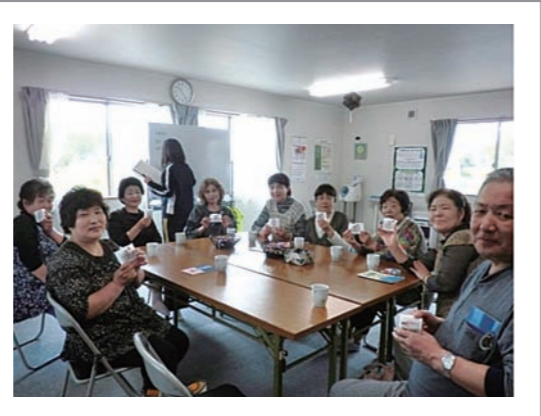
広島からお菓子と笑顔をお届けすることができました。