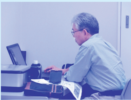
〈パソコンによる点字印刷作業〉

車椅子を借りるため安芸区社協へ行った時、ボランティア大学の案内が目にとまりました。受講して、手話と点字に興味を持ち、点字の活動日が都合と合って、妻の病状も落ち着いていたので、点字サークルで活動することにしました。それから8年ぐらになります。