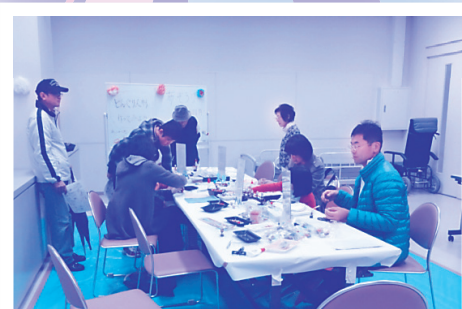
〈どんぐり人形づくり〉

ボランティアまつりボランティア募集 受付・どんぐり人形づくりなど 詳細は安芸区ボランティアセンターまで