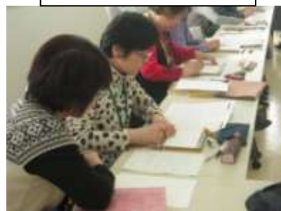
点字体験もマンツーマンで