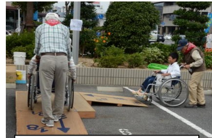
ボラフェスの車いす体験

平成15年5月、男性のボランティアグループとして誕生、来年10周年を迎えます。ボランティア参加者の多くは女性だった10年前、男性の力と技が必要とされるさまざまな活動をカバーしようと立ち上がり、グループ名を南区の正義の味方「なんぱんまん」と命名、その名の通り障がい者の支援やさまざまなイベント、施設訪問、マージャンやお話相手などなど、多彩な活動を行っています。