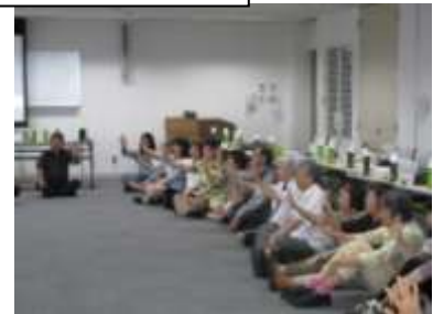
「笑いヨガ」の体験中！