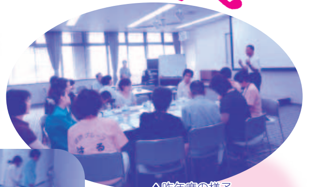
△昨年度の様子 「安芸区で活躍するボランティアグループさんたちとの交流。♪わきあいあいです♪」