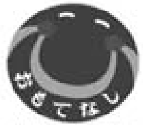
広島市東区もてなしのシンボルマーク