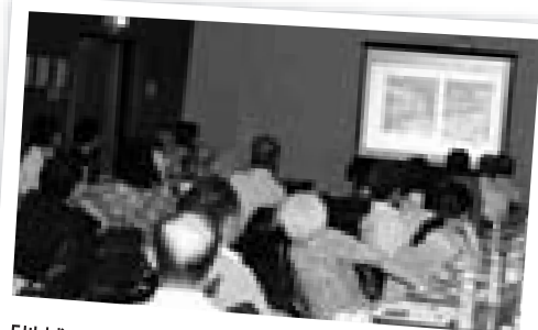
「地域での災害時の対応について学びました(上温品)」