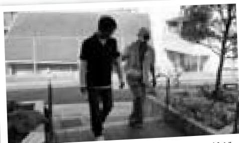
「福祉体験を通して、住民同士の助け合いの輪が広がりました(アイマスク・手引き体験中/早稲田)」