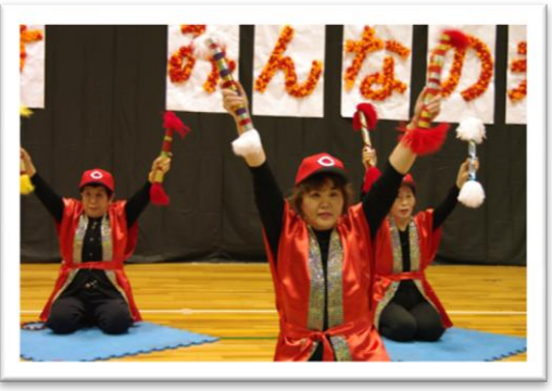
昨年のステージ発表の様子

日時: 12月4日(日) 10:00~16:00 会場: 広島市心身障害者福祉センター (東区光町 2-1-5) 内容: 作品展示、パフォーマンス広場、模擬店、体験コーナー、 広島東洋カープ選手との集い(予定) 他 問合せ先: 広島市心身障害者福祉センター 2011文化祭実行委員会事務局 TEL 261-2333 / FAX 261-7789