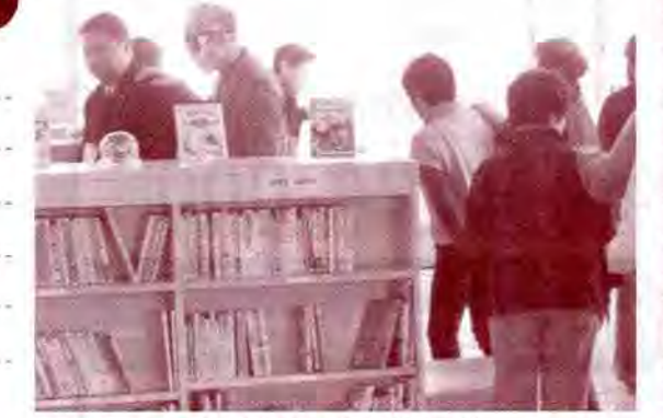
▲アイマスク体験(吉島公民館主催) みなさんがお住まいの地域でも福祉体験学習を行っていただけます。