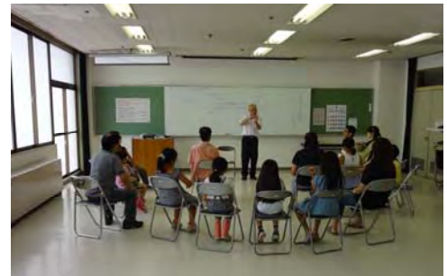
▲夏休みこども手話教室

今回は、聴覚障害者理解のための交流と手話の学習を30年以上続けておられる手話サークル「かたらい」の活動見学にお伺いしました。この日の「かたらい」は3名の健聴者の方とろうあ者の方が楽しくお話しをされていました。テーマは日常の生活で困ったことで、皆さん自由に語り合っておられました。かたらいの活動としては、毎年夏休みに中央公民館で開催される小学生を対象とした「夏休みこども手話教室」の講師を務めておられます。2日間の講座の中で、子どもたちからは「家に電話がかかってきたときどうするんだろう？」という疑問が出てきて、聞こえる私達にとってあたりまえのことが、あたりまえでなくなることに気づいてくれたことをとても喜んでおられました。