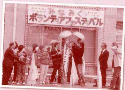
▲「せ〜の!」でくす玉を割って始まり〜