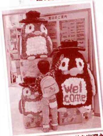
▲手作りキャラがお出迎え