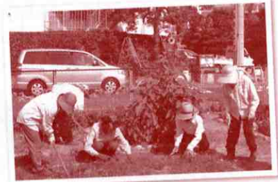
▲炎天下での活動も大変です

発足からすでに10年以上経つサロンですが、これからも「無理をせず、楽しく、長く続けていきたい」と皆さんおっしゃっています。