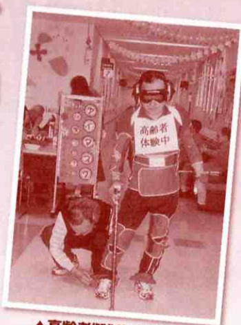
▲高齢者疑似体験コーナー