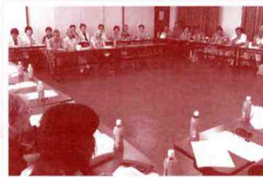
▲多くの方が参加されました

よりよいサロンづくりを進めていくため、このような交流会は大変、有意義なものではないかと思えます。