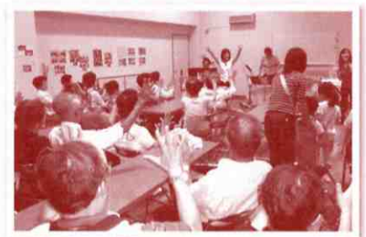
▲皆で楽しく合唱しました

開催日時：毎週水曜日 10:00～12:00 会 場：段原西集会所(広島市南区段原二丁目11-18) 参加費：500円/月