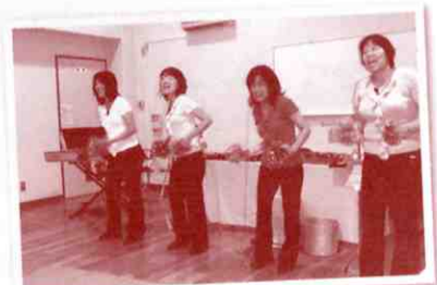
▲納涼コンサートにアフェットの皆さんをお呼びしました

このように「陽だまり」は、地域の皆さんやいろいろな機関が協力しながら、楽しい「居場所」づくりの取り組みを進められています。その「陽だまり」は来年、10周年を迎えます。現在、「ボランティアだんばら」発足10周年記念の冊子などの作成が進められています。「陽だまり」と共に歩んだ10年間の思い出は…。どんな冊子ができあがるのか、今から楽しみです。