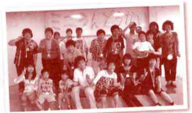
▲「はい、チーズ」マイキーズの皆さん