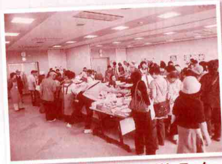
▲掘り出し物さがしのバザーコーナー