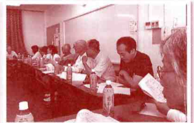
▲熱心に情報交換をしました