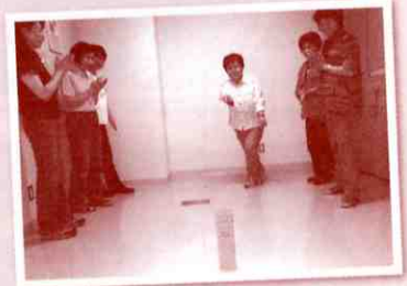
▲クップを楽しんでいます

基本的な遊び方は2チームに分かれ、それぞれのチームの陣地に5本のクップを横1列に並べて、敵チームが「カストピナ」と呼ばれる丸棒6本を相手クップめがけ投げ入れるというものです。これを両チーム繰り返す、先に相手陣地のクップ5本全て倒したチームが、フィールドの中心に置かれたキングと呼ばれる大きなクップを狙う権利を持つことができます。そして、このキングを倒したチームが勝利となります。クップは老若男女、室内外問わず楽しむことができます。