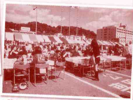
▲駐車場にテントが並びます