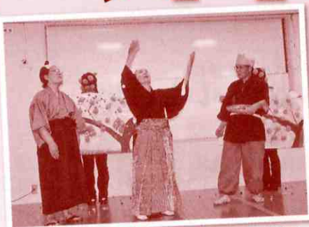
▲手話劇「花さかじいさん」の一場面