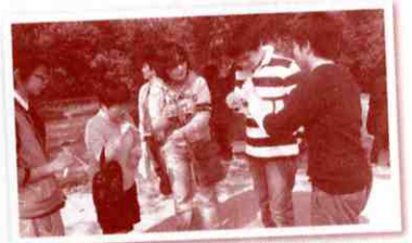
▲スマイリングの活動の様子