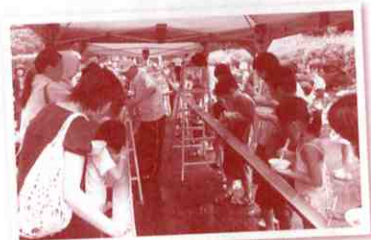
▲そうめん流しも楽しい思い出です