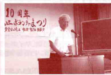
▲利田会長の挨拶の様子