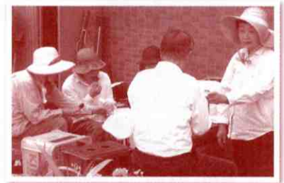
▲冷たいお茶で一息しています

開催日時：毎週日曜日 9:00～11:00 会 場：広島市南区西霞町7番地、8番地 参加費：無料