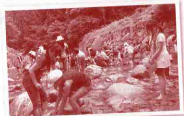
▲魚のつかみ取りをしました

それぞれの親子で、また、子どもたち同士での楽しいふれあいの一日となり、みんなのこの夏のよき思い出となったことと思います。