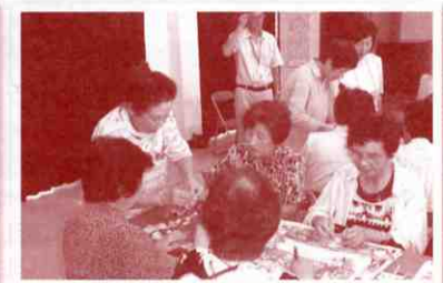
▲皆さんと楽しい一時をすごしました