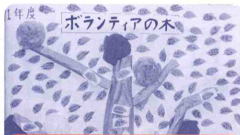
参加者からのメッセージで作成したボランティアの木