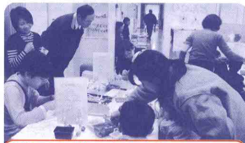
どんぐり人形づくりコーナー