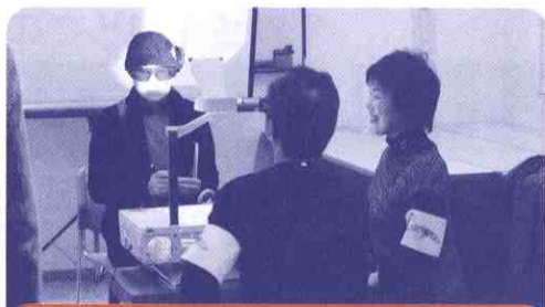
要約筆記体験コーナー