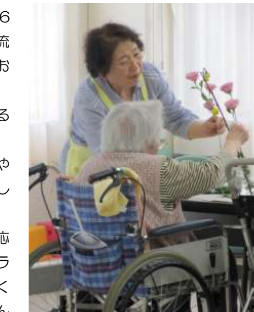
きれいな花に心が和む一時です

限られた時間の中で忙しく、でも生き生きと動いているボランティアさんは、施設の中に新鮮な風を運んでいるんだなあと、ほのぼのとした気持ちになった1日でした。