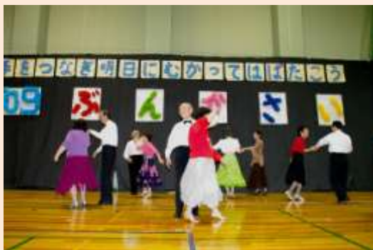
昨年のステージ発表の様子

掲載記事に関するご意見・ご感想、各講座などへの参加申込につきましては、東区社会福祉協議会までお問合せください。（TEL：263-8443 / FAX：264-9254）