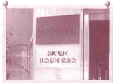
入り口にはプレートが作成されました。

袋町地区社協では、これまで活動拠点が無く、地区社協の会長宅を代々事務所としていました。そんな状況を変えようと地区社協のお世話をしてくださっていた方が、袋町学区会館を地区社協の事務所にしたいと働きかけを行っていました。