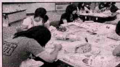
乳幼児おもちゃづくり