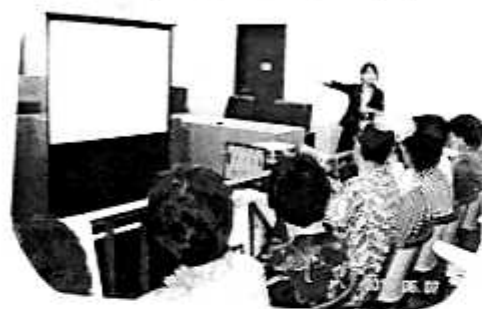
「★裁判員制度の学習」