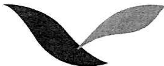
広島大会シンボルマーク

新しい力がつながりあい、いかしあうことで新しい力を生む。この力が新たな社会課題や生活課題を解決していく民力として高められていくことをめざします。