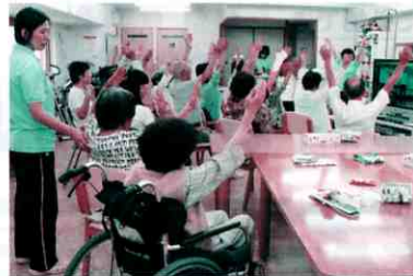
▲昨年度の様子 「高齢者デイサービスでの ボランティア体験をしよう!」

申込み・問合せ 安芸区ボランティアセンター (TEL) 821-2503 (FAX) 821-2504