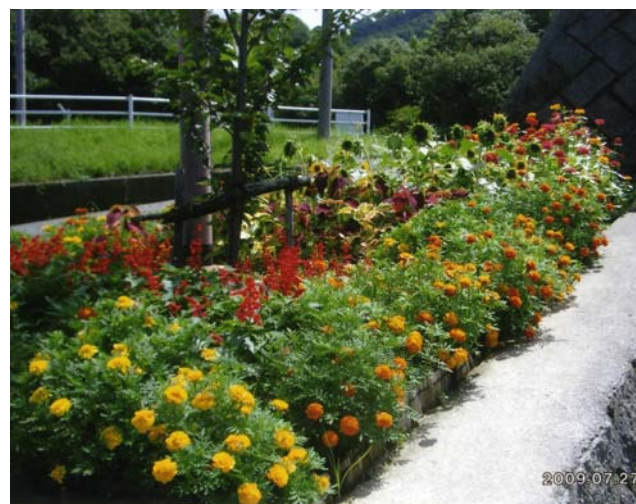
はぐくみの里で公園花壇用の花を育てています