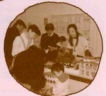
▲スタンプラリー景品交換