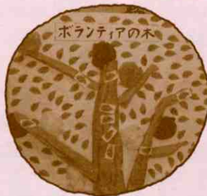
▼みんなの想いを集めた ボランティアの木