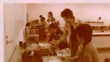
▲デージー図書研修会の様子