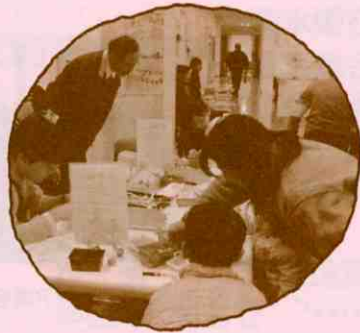
▲どんぐり人形づくり

11月29日(日)、安芸区民まつり会場において、「安芸区ボランティアまつり」を開催しました! 例年より開催日が遅くなったことで寒さが増し、ボランティアまつり名物の“豚汁”は、正午には準備していた300食が完売となりました。また、総合福祉センター3階会場では、スタンプラリーやフリーマーケット、手話・点字・要約筆記・朗読録音・車いすの体験に、どんぐり人形づくり・紙芝居などを開催し、多くの人たちで賑わいました。