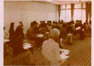
▲話し相手ボランティア講座より

日時 平成22年1月28日(木) 13時30分～15時30分 会場 安芸区総合福祉センター 3階 ボランティア研修室 【お問い合わせ】 安芸区社会福祉協議会・安芸区ボランティアセンター TEL/821-2503 FAX/821-2504