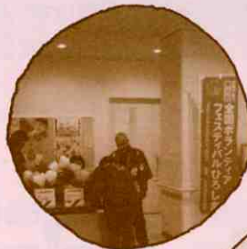
▼ハート型風船の配布