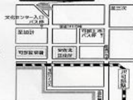
安佐北区民文化センター