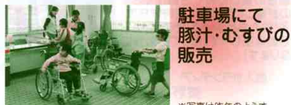
駐車場にて 豚汁・むすびの 販売