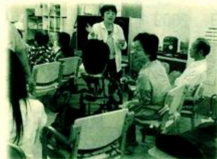
▲平成 21 年度 安芸区ボランティア大学「高齢者デイサービスセンターで話し相手をしてみよう」の様子

日時 平成 21 年 12 月 8 日(火)～12 月 22 日(火) 10 時～12 時 (全 3 回) 会場 安芸区総合福祉センター 3 階大会議室 (安芸区船越南三丁目 2 - 16) 内容