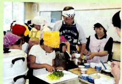
昨年度の入賞作品より