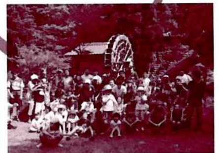
みんなで記念撮影「ハイチ～ス!」：龍頭峡

障がい者も健常者も何も変わらない。トラブルや注意すべきことが少し多いだけ、ただそれだけなのだということを学びました。今後はもっと体験を増やしていきたいです。