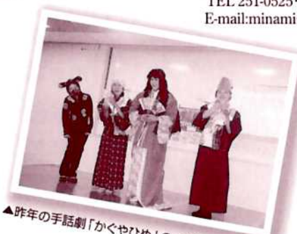
▲昨年の手話劇「かくやひめ」の一場面