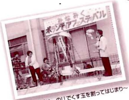
▲「せ〜の!」でくす玉を割ってはじまり〜

社会福祉法人 広島市南区社会福祉協議会 広島市南区皆実町一丁目4-46 南区地域福祉センター内 TEL 251-0525・251-0505 FAX 256-0990 E-mail:minami@shakyohiroshima-city.or.jp