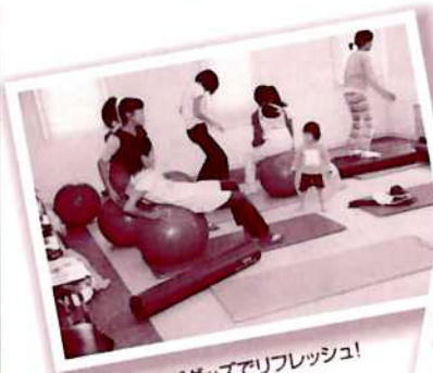
▲トレーニンググッズでリフレッシュ! (昨年の様子)