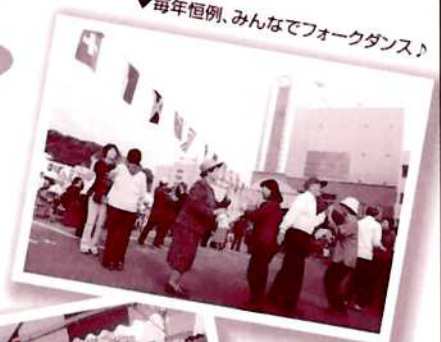
▼毎年恒例、みんなでフォークダンス!