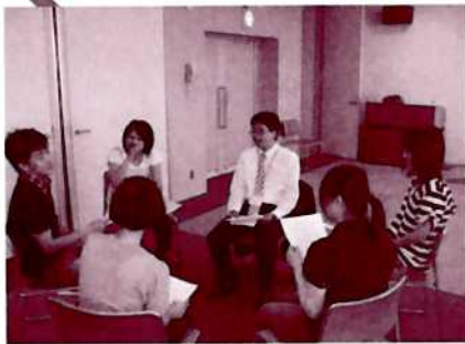
まずはみんなで仲良くなろう！ ：レクリエーション研修

レクリエーションは、ただ仲良くなるためだけでなく、それぞれにいろいろな目的やどのような人に合せたものなのかなど、多くの意味があることも知り、これからもっと勉強していきたいと思いました。