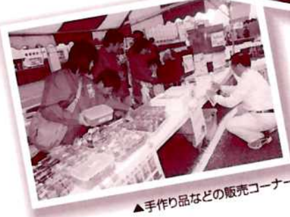
▲手作り品などの販売コーナー