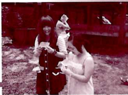
「スイカおいしいね!」：龍頭峡へのバスハイク

今年は高校生・大学生合わせて10名が、「レクリエーション研修」、「障がいについてのお話」、「障がいのある子ども達とのバスハイク」や「知的障がい者が働く場での体験」など、様々な体験をしました。