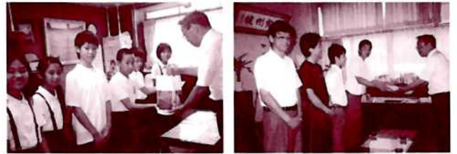
▲仁保小・中での贈呈式