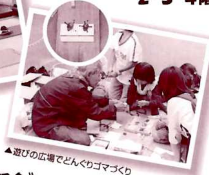
▲遊びの広場でどんぐりゴマづくり