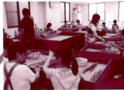
障がいのある人が働く現場で体験しました。

障がいのある人と一緒に仕事をしていて、素直さややさしさにふれることができました。