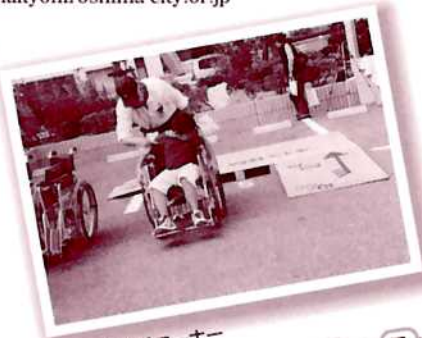
▲車いす体験コーナー