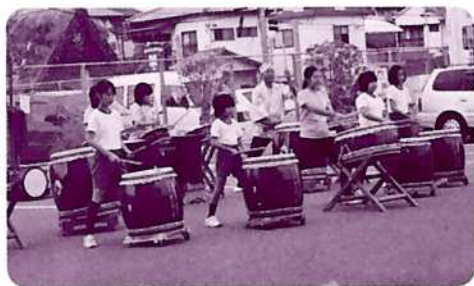
▲昨年のまつり風景