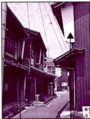
今では珍しい「うだつ」のある家屋

珍しい、古い町並みが残っているのは、原爆による被害が比較的少なかったからとのこと。しかし、町並み保存は個人の所有物の管理にもなるため難しく、時代とともに少なくなってきました。平成10年に長年にわたり地域に親しまれた大石餅の廃業にあたって、町内会・女性会・老人会などの各種団体がお別れイベントを行いました。その時「草津のまちを愛する会」が立ち上がり、西区魅力づくり事業の実施時期と重なったこともあり、平成12年「草津まちづくりの会」発足へつながりました。毎年9月の初めには草津まちオープンミュージアム(町全体を一つの博物館にみたてたイベント)を実施しています。また、町内の酒蔵での音楽大学の卒業生によるコンサートも開かれています。中には広島市以外からの参加される方もおられ、1時間コース、2時間コースに分かれて、ガイドボランティアの案内のもと、草津の町を散策することです。