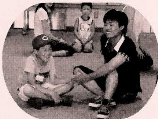
サマースクールで子どもとのふれあい中