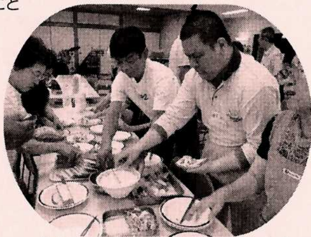
みんなでロールサンドを作りました！