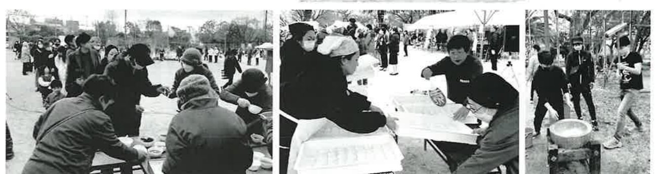
餅つき・ぜんざいの振る舞いも再開されて祭りの活気も戻り、参加の皆さんも大喜び。400人分のぜんざいもあっという間に無くなりました。