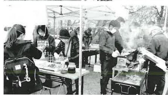
青少協の焼き鳥とアスパラの豚肉巻は食欲をそそる良い香りを漂わせます。

さらに、元気な子どもたちも大勢参加してくれました。吉島中学校の生徒は、平和の灯を貰い受けたトーチを持つてのランニング、中島小学校の3・4年生の子どもたちは、運動会で踊った「中島ソーラン2023」を披露。とんどの点火では5・6年生の年男・年女の子どもも加わりました。また、公園の空きスペースでは、凧揚げや羽根つきなどの「昔遊び」を楽しむ子どもたちの声が響きました。 本年も、地域の皆さんのご健勝とご多幸をお祈り申し上げます。 (中島地区社協 事務局)