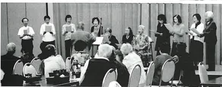
オ木さん率いる「コーラスさくらんぼ」のハーモニーに魅了されました。