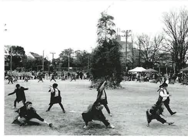
「中島ソーラン2023」を踊る中島小学校3・4年生の子どもたち。

令和6年1月7日(日)、吉島公園にて「中島地区ふれあいとんど祭り」が行われました。コロナ禍以前のように、餅つきやぜんざいの振る舞いなどを含めての「完全版」のとんどを開催するのは実に4年ぶり。 一方、飲食の提供については、新型コロナウイルスなどの感染防止と衛生管理の徹底が求められる、食材を扱う人の手指消毒やマスク・手袋の着用はもちろん、食材の調理方法・場所(環境)についても指導がありました。 少々不便を感じながらも、従前の準備・手順を思い出しながら、みんなで協力して、コロナ前の活気に満ちたとんどとなりました。