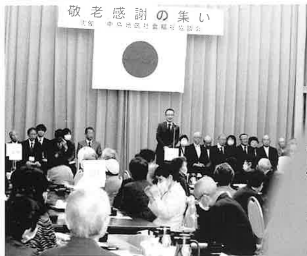
敬老感謝の集い 主催 中島地区社会福祉協議会

中島地区社会福祉協議会は中島地区のみなさんに一番身近な福祉・ボランティア団体です