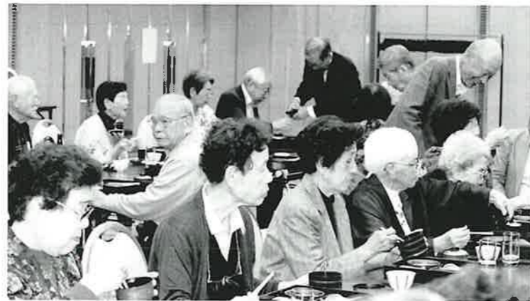
友人やご近所さんと共に、会食できる幸せを実感したひと時です。