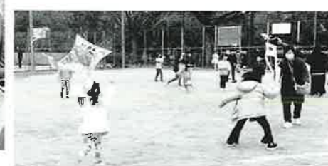
もみじ作業所は「むかし遊び広場」で、凧揚げ・けん玉・竹馬・羽つきなど、子どもたちに貴重な体験を提供。

さらに、元気な子どもたちも大勢参加してくれました。吉島中学校の生徒は、平和の灯を貰い受けたトーチを持つてのランニング、中島小学校の3・4年生の子どもたちは、運動会で踊った「中島ソーラン2023」を披露。とんどの点火では5・6年生の年男・年女の子どもも加わりました。また、公園の空きスペースでは、凧揚げや羽根つきなどの「昔遊び」を楽しむ子どもたちの声が響きました。 本年も、地域の皆さんのご健勝とご多幸をお祈り申し上げます。 (中島地区社協 事務局)