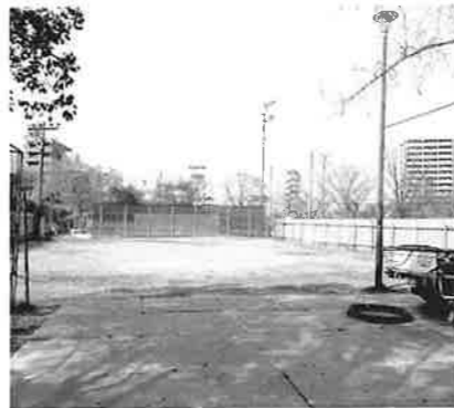
建設場所のテニスコート東側。 フェンスで囲まれ、基礎工事に入ります。

令和6年度に移転・新築予定(現集会所解体も含む)の中島集会所については、新築工事の入札不調のため、着工が延期されていまして、本年1月に新築工事・電気設備工事の落札業者が決まり、本年10月末の完成予定で着工することになりました。 さらに、NTT宇品東様から書庫・事務機・椅子・パーテーションなどをご提供いただくことになり、事務機能の充実と開設準備費用の軽減が図れ、喜ばしい限りです。 これから、吉島公園のテニスコートの隣で工事が始まります。近隣にお住いの方には色々ご迷惑・ご不便をお掛けすると思いますが、中島地区の新たな活動拠点の完成を見守っていただければと思います。 (中島地区社協 事務局)