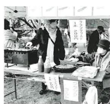
民児協のフランクフルトも大人気！

令和6年1月7日(日)、吉島公園にて「中島地区ふれあいとんど祭り」が行われました。コロナ禍以前のように、餅つきやぜんざいの振る舞いなどを含めての「完全版」のとんどを開催するのは実に4年ぶり。 一方、飲食の提供については、新型コロナウイルスなどの感染防止と衛生管理の徹底が求められる、食材を扱う人の手指消毒やマスク・手袋の着用はもちろん、食材の調理方法・場所(環境)についても指導がありました。 少々不便を感じながらも、従前の準備・手順を思い出しながら、みんなで協力して、コロナ前の活気に満ちたとんどとなりました。