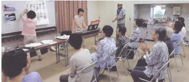
「ハワイ航路」コスプレで笑いの脳活性。

このサロンは「 広島市高齢者いきいきポイント 」対象事業です。家に閉じ込められず、お出かけください!!