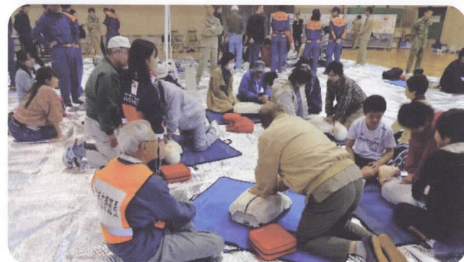
AEDの取り扱い方を習った後、胸部圧迫手当を全員で実習。パッドを体に付け、スイッチを入れたら、体から離れてください!