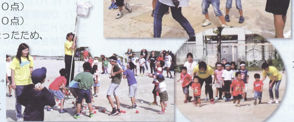
玉入れ、なんで入らん!