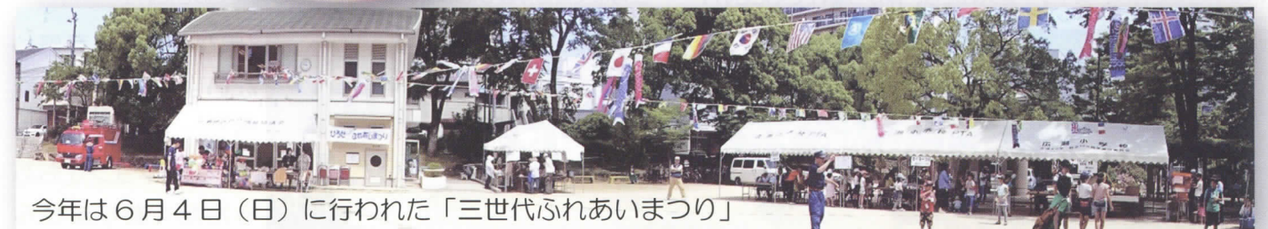
今年は6月4日(日)に行われた「三世代ふれあいまつり」

広瀬集会所と広瀬北町公園で毎年行われる「ひろせ三世代ふれあいまつり」では、ボランティアの皆さんが作るうどんを食べて、風船飛ばし、輪投げ、ストライクナインなどで遊ぶ子供たちの元気をもらいました。