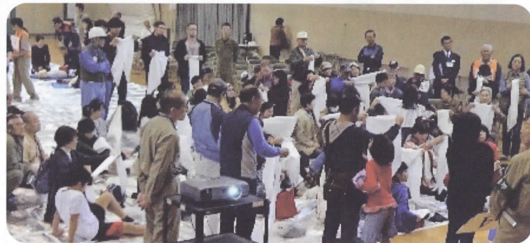
三角巾で実習体験した応急手当の方法はぜひ覚えておきたい!