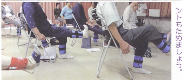
百歳体操で筋力づくりをみんなと一緒にしてポイントためましょう。