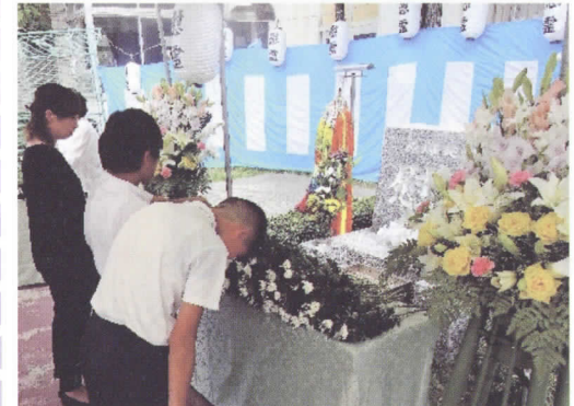
午前十時からの慰霊式典では児童も含めた参列者全員で献花します。夕方七時からの盆踊りには幼児からお年寄りまで伝統行事を楽しみます。

目となりました。慰霊の気持ちを持って、ふれあいの場として参加をしていただきたいと思います。かつては各町内会ごとに催していた盆踊りは合同で行うことで担い手不足を補っています。暑い夏の行事ですが誘い合ってお出かけください。