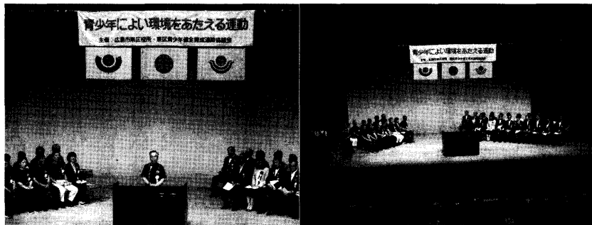
「青少年によい環境を与える運動」東区推進大会