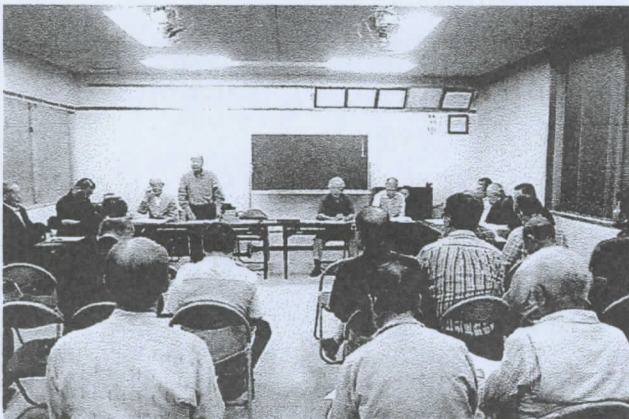
総会の会場の模様