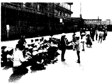
1年生を迎える会より