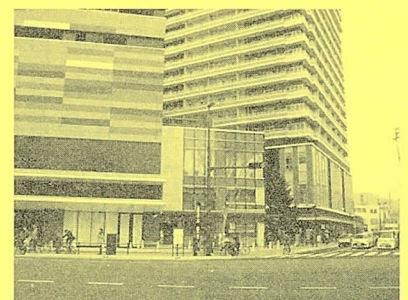
エキシティヒロシマ