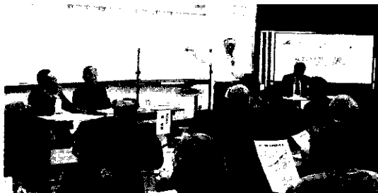
▲ 第1回 みち今昔物語

3地域は、坂にある団地で同じ年代(1970年代)に山を切り開いて造成され、共通点も多い地域が交流を図りながら、住んでいる町を故郷のように大切に思い、これから発展させるために講座を開催。