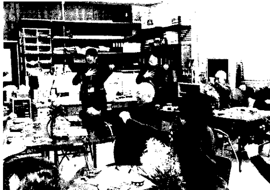
▲ ふれあいサロンの健康体操