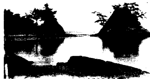
井口ノ井戸安藤内戸