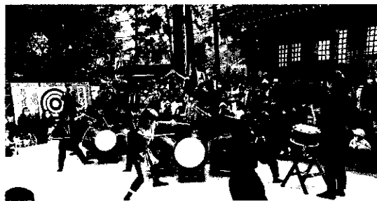
▲ 井口淨太鼓の奉納太鼓