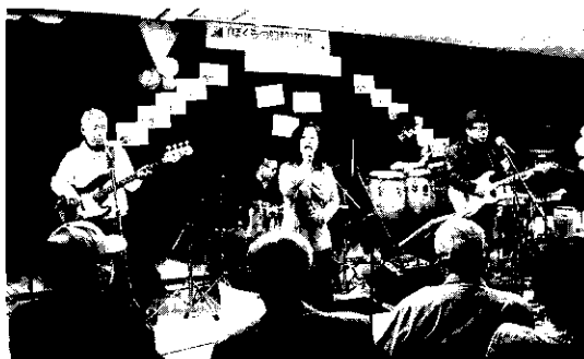
▲ ナンジャーズのみなさんの本格的な演奏

第3回目は、井口公民館で「まちの音楽喫茶」と題して、昭和に流行った懐かしい曲を演奏。1部ではナンジャーズの演奏で「ダンシングオールナイト」などの名曲を、2部では公民館利用者グループの方の演奏の披露があり、最高潮。