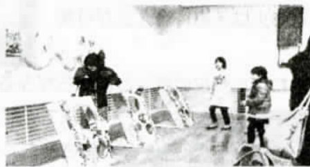
(中学生ボランティアと一緒にゲームラリー)

した。最後には、厳かな雰囲気の中でのキャンドルサービスとサンタさんからのプレゼントもあり、一足早いクリスマスとなりました。