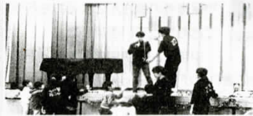
(広島大学ジャグリング同好会の皆さん)

尾長学区子ども会の、クリスマス会と子どもまつりを合体させた『子どもクリスマス』が、12月23日（金）に尾長小学校の体育館で行われました。