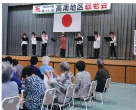
オカリナ白木サプリの皆さん