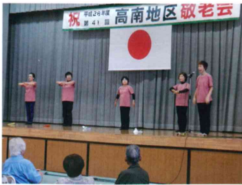
手話サークル白木のみなさんの合唱