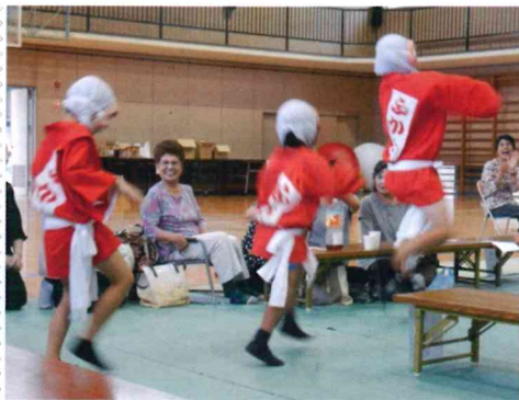
深瀬ヒョットコ同好会の熱演

高南社協の三大自然の一つ、敬老会を皆様のご協力のもと盛大に開催することができました。参列者の皆様はもちろんのこと、各評議員（自治会長）、民生・児童委員、ボランティアでご協力いただいた皆様、敬老会を底辺で支えていただきました。またアトラクションに積極的に参加いただき参列者をはじめ、会場に居るもの全員を楽しませてくれた皆様有難うございました。