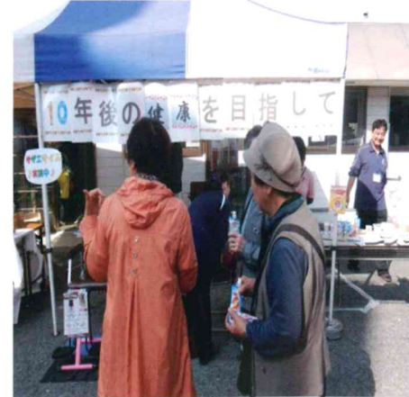
十年後あなたは健康に 自信がありますか