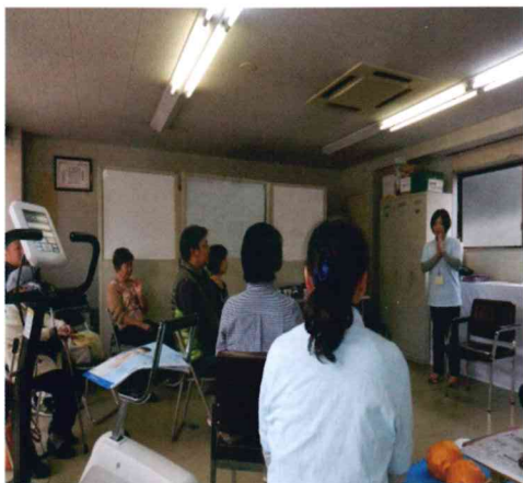
サザエさん体操で健康寿命を延ばしましょう

こちらは白木包括支援センターです。地域包括支援センターの業務は、皆さんがいつまでも健やかに住み慣れた地域で生活できるようにすることです。「介護予防の促進」「共に支えあい見守りの出来る地域づくり」に取り組んでいます。 また保健・医療・福祉全般に関する相談、介護予防、皆さんの権利を守ることを、地域のネットワークづくり等の業務もしています。