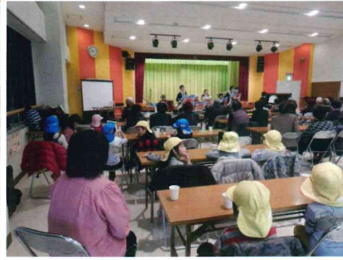
ジートルズの楽器演奏を真剣に見学する保育園児達

養成講座も随時開設しています。地域の皆さんが気軽に相談して頂くことから解決に向けて進んでまいります。 職員八名で四学区を担当し頑張っています。まずはお気軽にお問い合わせてください。