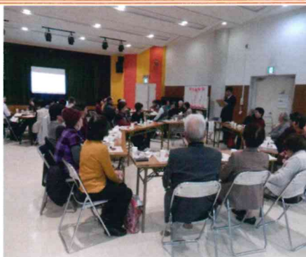
3グループに分かれてお茶しながらの「つぶやき」タイム。皆さんの「思い」や「本音」よく聞けます。