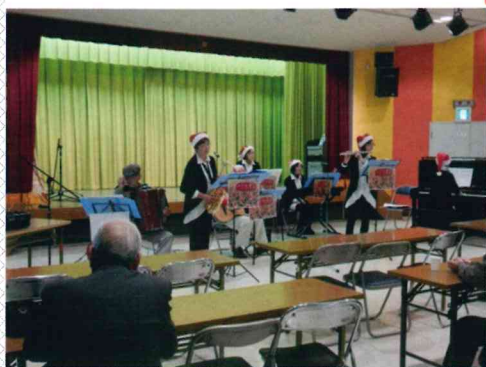
ジートルズ(7名)の懐かしのメロディー演奏風景 高齢化が進み団員の数が減っているとか。