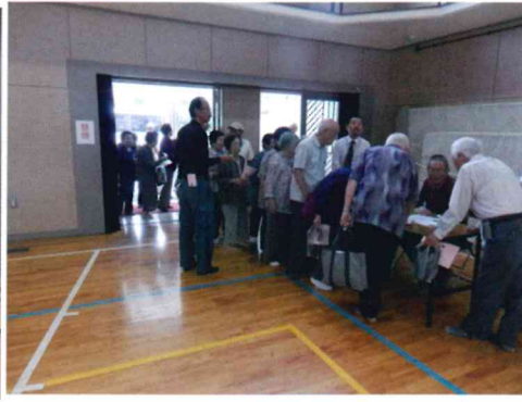
にぎやかな混雑する受付風景