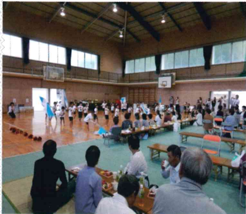
いづみ保育園児の熱演風景

今年度まで七十歳以上を招待の対象としていましたが、次年度より他地区並に七十五歳以上にすることを検討しています。