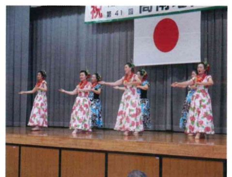
J Aスマイルレディーの皆さん