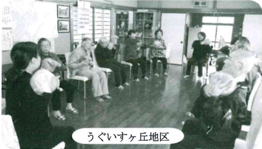
うぐいすヶ丘地区