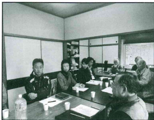
(児童問題作業委員会)

「福祉のまちづくりプラン」の作成作業は第二段階にはいりました。先日、より具体的に問題点を探ろうとしてまず「児童問題」について、小学校のPTA役員、主任児童委員、青少年健全育成連絡協議会役員、その他日常的に児童・幼児に接しておられる方々に集まっていたいただき「児童問題作業委員会」を開きました。その他の問題についても、お知恵を借りる作業委員会を開き、今年度中にまちづくりのプラン策定を終えたいと考えています。