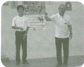
けん玉名人の演技

デジタル化が進む昨今ですが、今年はオリンピックをテーマに子どもたちの笑顔が児童館から溢れる事を願って、手作りでアイデア満載の楽しい祭りを計画しました。これからも児童館にたくさん遊びに来てください。