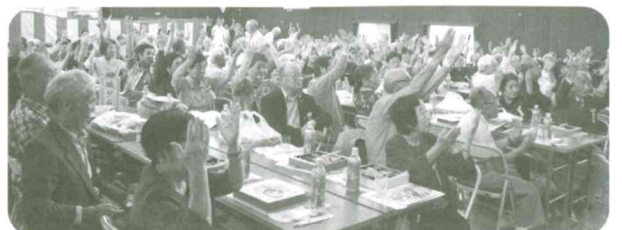
全員で♪ふるさと♪の手話