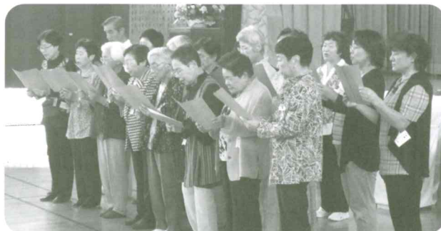
下岩ノ上いきいきサロンの皆さんによる詩吟