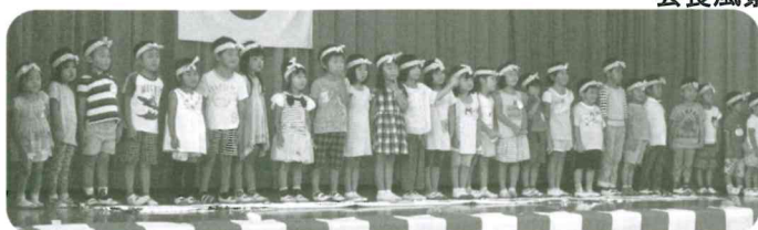
落合幼稚園の園児による歌♪