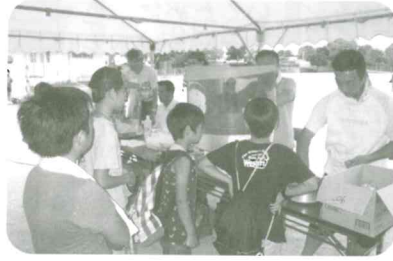
食べ物コーナー(綿菓子)

広報紙発行にあたり、連合町内会より、協力金をいただいております。ありがとうございます。