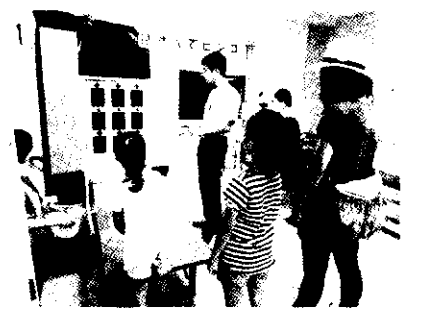
ピンゴゲームは楽しめましたか 児童館「あそびランド」