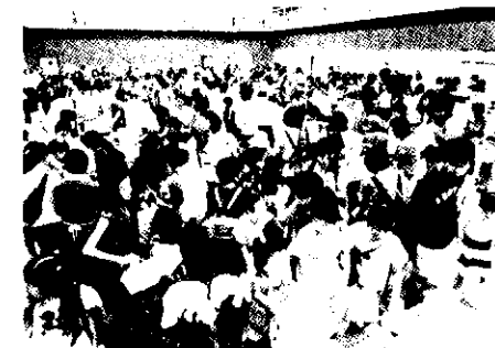
お目当ての品はみつかりましたか? バザー会場