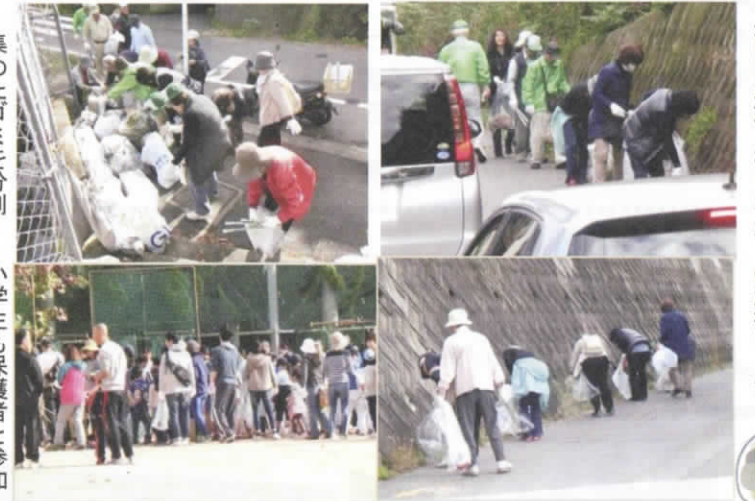
バイパスの側道は多くの車が通ります。車両に注意を払いながらの清掃でした。

ふれあい活動推進協議会・古田学区公衛協・古田学区社協関係者、古田中学校・古田小学校の生徒、児童、先生、保護者の皆様がボランティアで参加しました。中学校校庭に集合して、ゴミ袋、軍手、火鉢みを受け取り、公衛協・社協関係者は、バイパスの側道、中学生・小学生・先生・保護者は町内を担当し、古田小学校区の清掃活動を行いました。