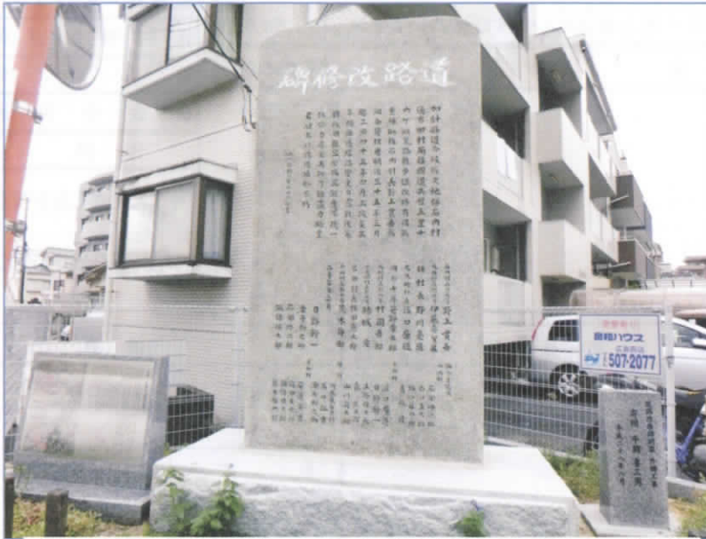
長年の風雪に耐えた石碑。このたび工事を担当した石屋さんによると石は極めて大きく良いものだそうです。