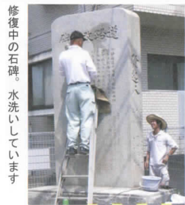
修復中の石碑。水洗いしています