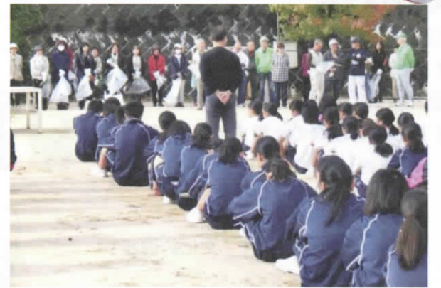
ご協力ありがとうございました

10月29日(土)、西区散乱ゴミ追放キャンペーンの一環行事として、ふれあい地域清掃が実施されました。