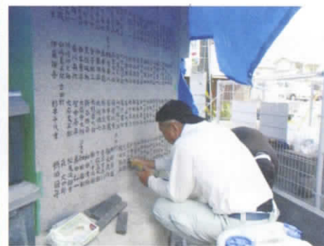
薄くなっていた文字に墨入れ