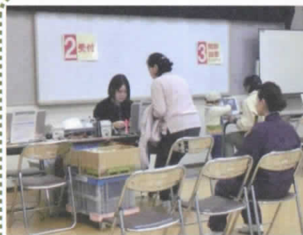
問診票記入→受付→問診回答→血圧測定→血液検査→献血へ