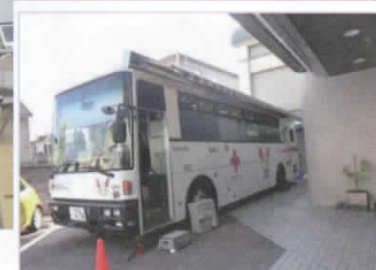
古田公民館玄関前の献血車

11月4日(金)、古田公民館を会場に9時から12時まで。古田学区ではあらかじめ掲示板や回覧板で献血のお知らせをしました。当日も女性会が呼びかけや会場での案内をしました。 ※献血された方のコメント 「昨年も来たのですが、献血できませんでした。今年は、体に気を付けて献血することができてうれしかったです。」