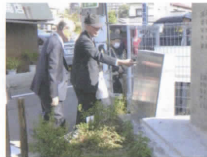
新しく設置された石碑の説明板