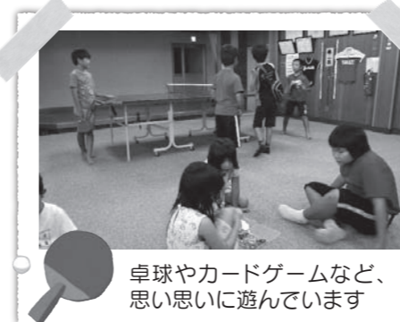
卓球やカードゲームなど、思い思いに遊んでいます