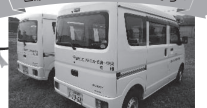
平成28年寄贈(右側) 平成19年寄贈(左側)