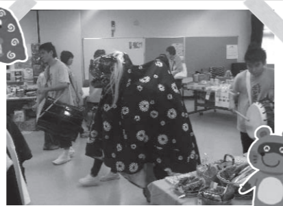
「ぼんぼこ座」による獅子舞と太鼓