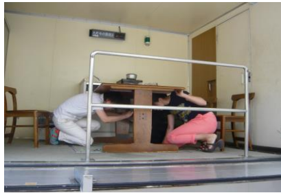
ビューハイツ自治会 防犯・防災担当