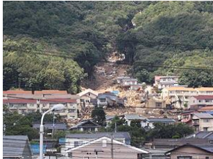
鈴が峰地区自主防災会連合会

避難所生活の方法や注意事項を検証し、人工呼吸や消火器の操作などを体験、最後に炊き出しに舌つづみを打ちましょう。