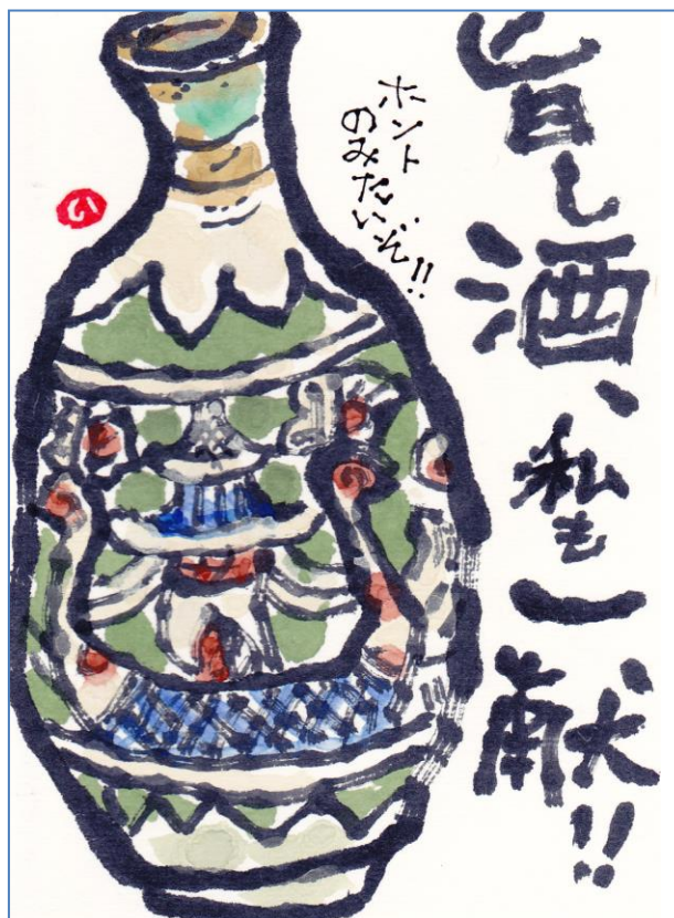
尾上 育子さん 作