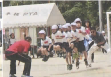
長縄 10人跳び おとうさん、縄まわし全力で