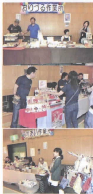
3つの作業所の販売コーナーと寄贈品のバザー会場の様子です。