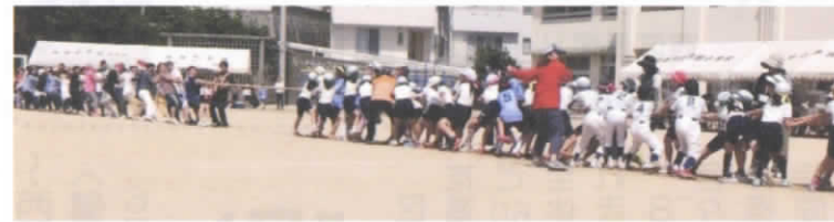
綱引き 5, 6年生対保護者 大人に負けるな!