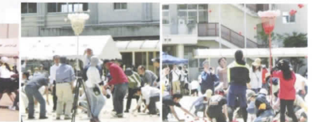
玉入れ 白の来賓対赤の保護者は、圧倒的に白の勝ち

5月8日(日)、古田小学校校庭で第13回「古田っ子運動会」が開催されました。未就園児の子どもたちから高齢者まで、様々な年齢の参加者は、共に競い、応援し、ふれあいました。長縄跳びでは、お父さん達が子ども達のために必死に縄をまわっていました。親子で De デートは、久々に子どもを背負い、重みで成長を感じたことでしょうか。玉入れは来賓がベテランのなせる技を発揮し圧倒的な勝利!最後のリレーで東町の優勝がきまりました。