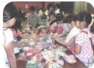
どれにしようかな……

『ふれあいひろば』は地域の 人たちの出会い、ふれあい、 助け合い、多世代の交流など を目的に行われます。