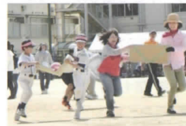
いちじくんリレー 落とさないように慎重に、急いで!