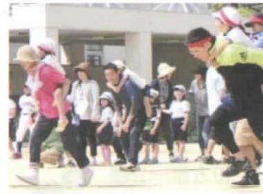
親子 De デート 我が子の成長を実感しました

皆様にご寄贈いただいた品物は、女性会、民生委員のメンバーが、暑い中ホールで一生涯懸命値付けをしています。