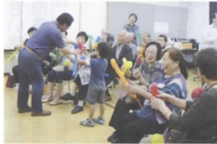
細長い風船でブードルをつくりました