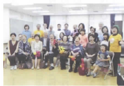
「あはは」とみんなで笑って記念撮影