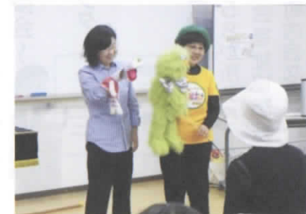
6月は腹話術ですよ