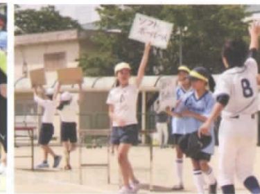
借り人競争 ヘルプミー! 「ソフトボールの人」「ハイ」