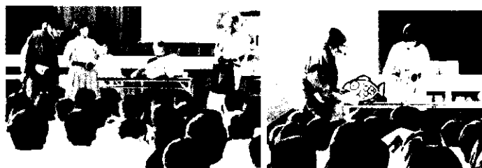
ちびまる子ちゃん一家のおじいさんが、「もし認知症になったら」という設定で、「あはは倶楽部」の皆さんが、よくない対応とよい対応を演じました。

平成28年度の古田学区社会福祉協議会の総会が、5月21日(土)に開催されました。そこで承認された決算を報告いたします。