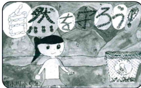
狩小川小学校5年生の作品です